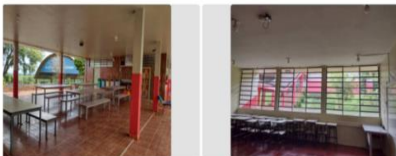
Imagem 11 e 12: Pátio coberto, refeitório e sala de aula no Colégio Estadual do Campo Profª Vilma dos Santos Dissenha.