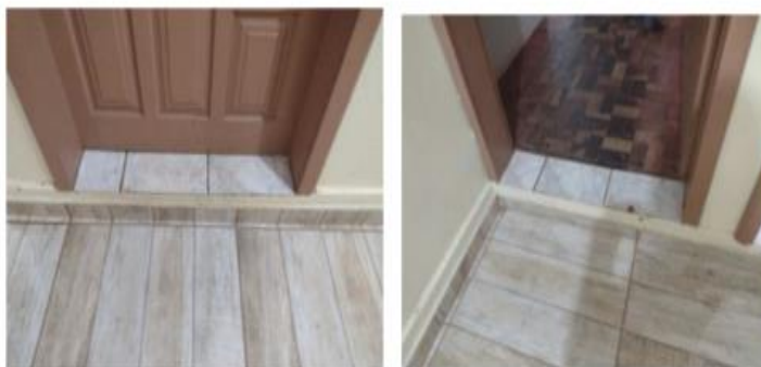
Imagem 2 e 3: Ausência de acessibilidade nas salas de aula e Biblioteca da Escola Estadual do Campo Conceição Linhares.

A edificação escolar apresenta sinais de má conservação e o não atendimento às exigências estruturais mínimas necessárias para o funcionamento adequado de uma instituição de ensino, entre as deficiências destacam-se a ausência de ambientes pedagógicos obrigatórios, como laboratório de ciências e a falta de acessibilidade para pessoas com mobilidade reduzida. Essas condições foram evidenciadas nas imagens a seguir, que ilustram as precariedades da estrutura física da escola.