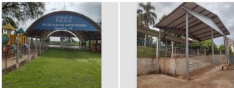
Imagem 9 e 10: Ginásio de esportes e acesso coberto do Colégio Estadual do Campo Profª Vilma dos Santos Dissenha.