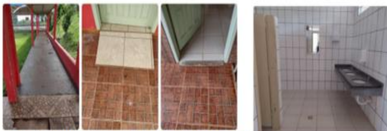
Imagem 13 a 16: Rampas de acesso no pátio e nas salas de aula. Banheiro masculino do Colégio Estadual do Campo Profª Vilma dos Santos Dissenha.