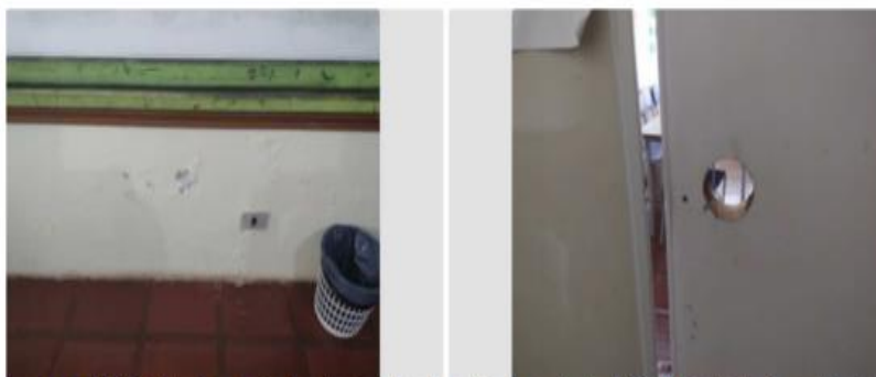
Imagem 4 e 5: Estado das paredes das salas de aula e da porta de acesso à sala da Escola Estadual do Campo Conceição Linhares.