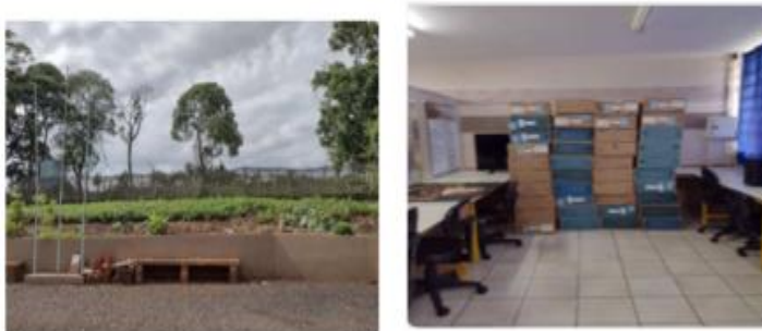
Imagem 17 e 18: Área externa e laboratório de informática do Colégio Estadual do Campo Profª Vilma dos Santos Dissenha.