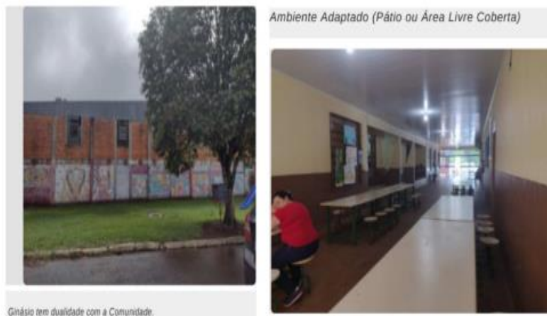
Imagem 6 e 7: Ginásio de esportes compartilhado com a comunidade e refeitório adaptado na circulação e acesso da Escola Estadual do Campo Conceição Linhares.