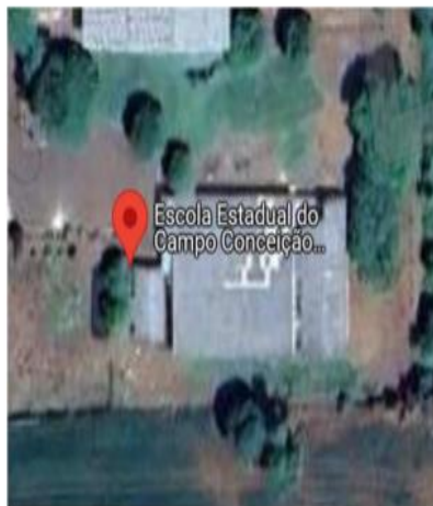
Imagem 1: Localização da Escola Estadual do Campo Conceição Linhares.

Cabe salientar que a Escola Estadual do Campo Conceição Linhares de Almeida funciona em dualidade administrativa com a Escola Municipal do Campo Pedro Antônio Casagrande, em imóvel de propriedade estadual.