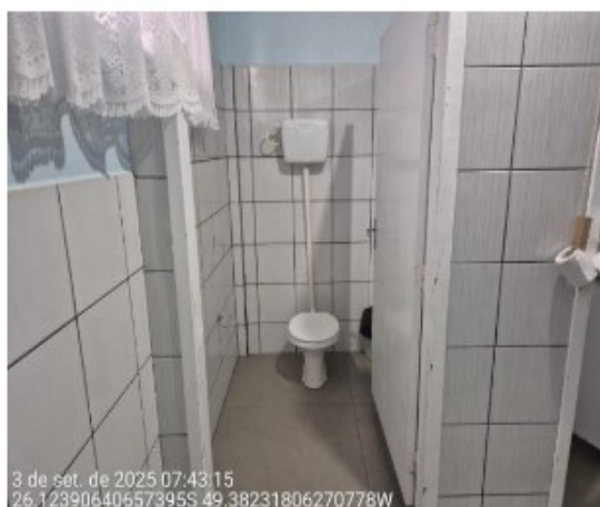
Foto 01: Cabine sanitária (última) no banheiro feminino a adequar.